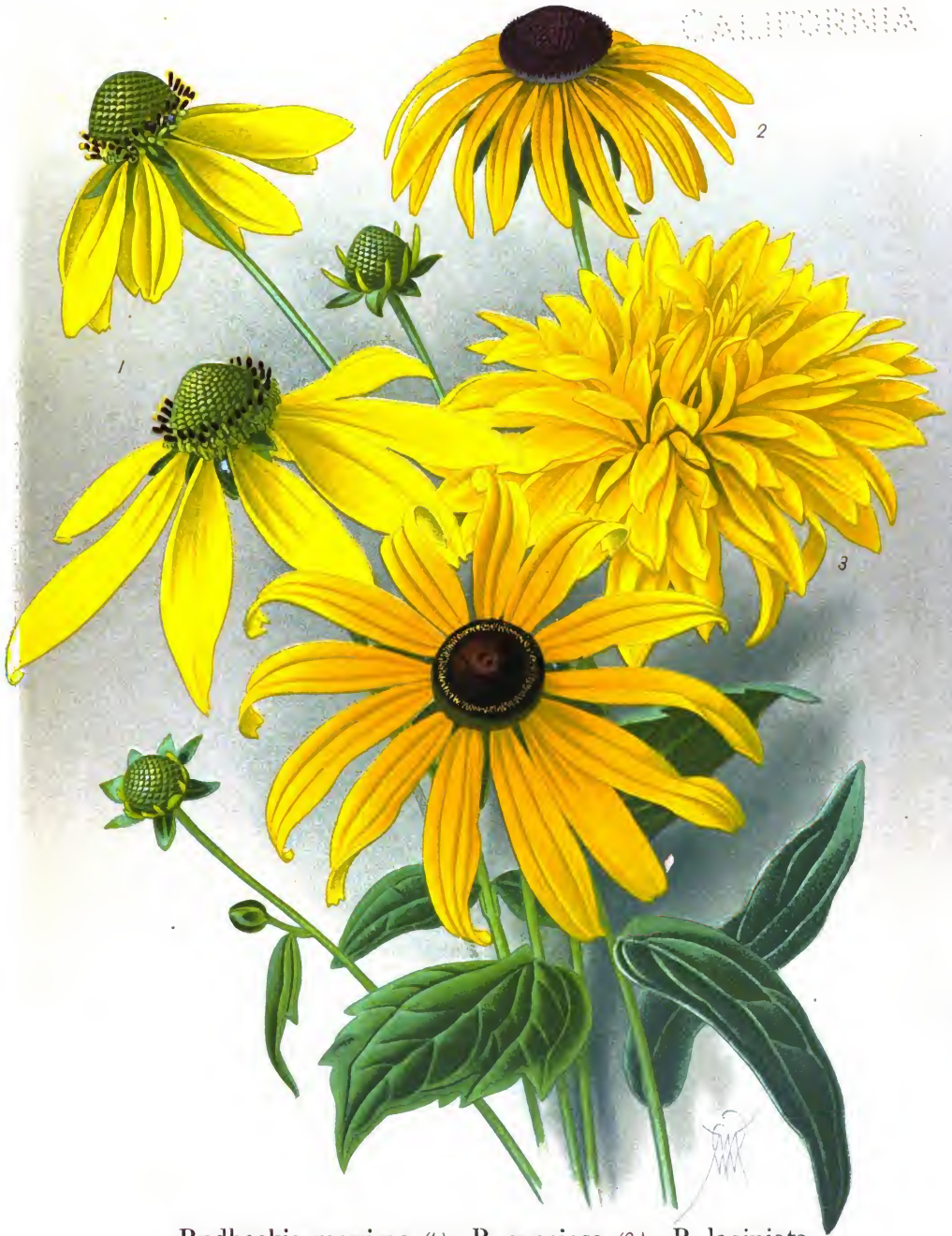
Rudbeckia maxima (1.); R. speciosa (2.); R. laciniata „Goldball“ (3.) et R. fulgida (4.).

Рудбекія крупноцвѣтная [1.]; Рудб. прекрасный [2.]; Рудб. разрывная „Золотой шаръ“ [3.] и Рудб. блестящая [4.]